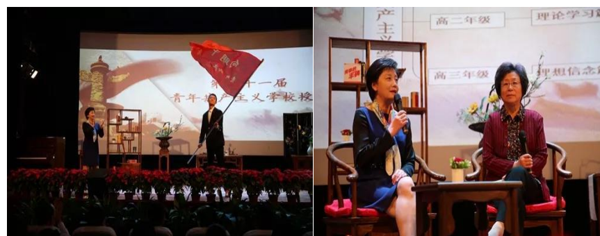
黄浦区向明中学青年共产主义学校成立三十周年活动