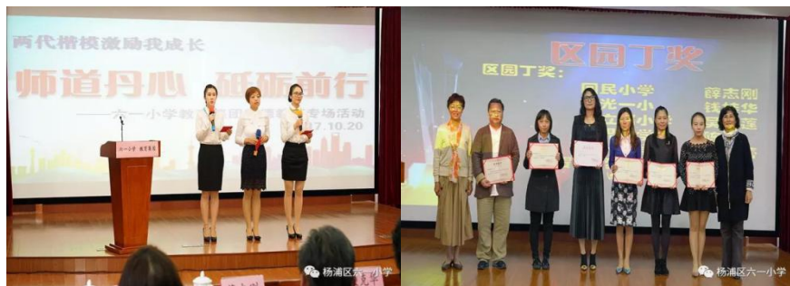
丹心耀师道，献礼十九大——杨浦区六一小学教育集团师德教育专场活动