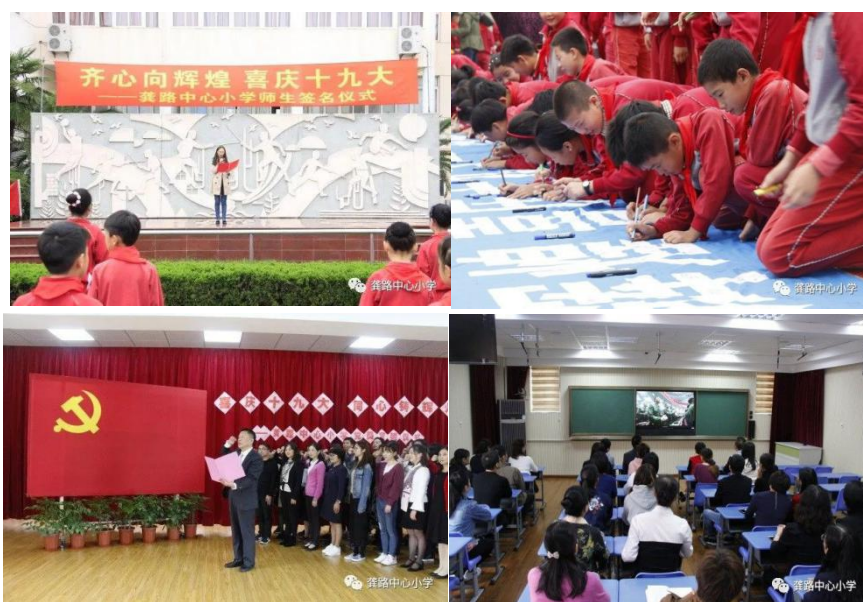
齐心向辉煌，喜庆十九大——浦东新区龚路中心小学举行庆十九大胜利召开系列活动