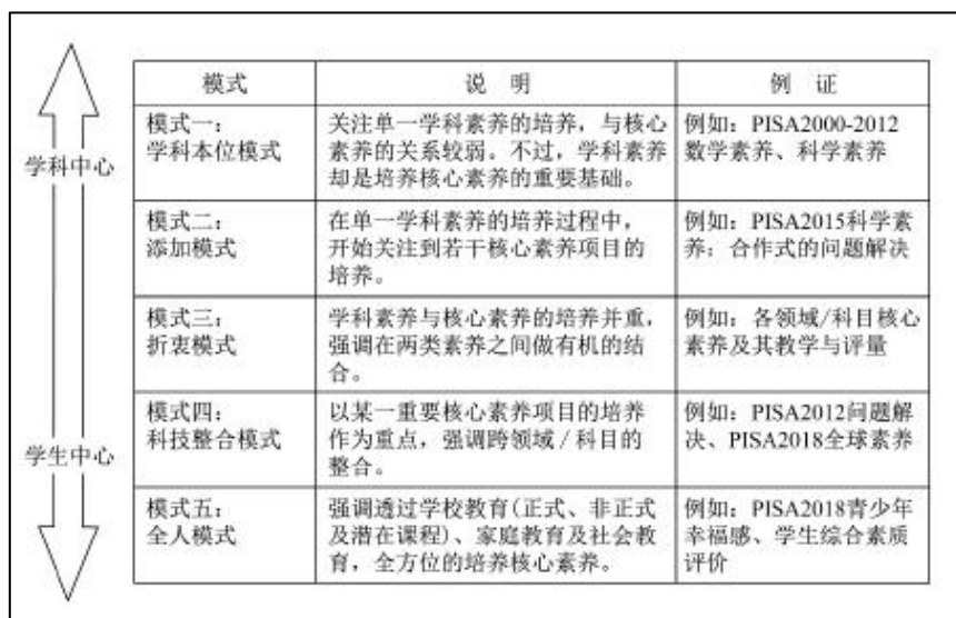
图3 素养导向的课程、教学与评量模式(群)

首先，课程、教学与评价是三位一体的关系。课程的设计与规划需要教学来实施，需要教师融会贯通地教给学生，而评价则是课程与教学的检测与审视。因此，三者是素养培养的基础。全球素养的培养，首先需要在课程设计和规划中得以体现，在学校的课程设计中需要把握全球素养的内涵融入，将“全球素养”的概念整合到各级中小学校的办学理念价值系统，在课程目标、课程内容设置和课程评价等环节突出全球素养的培养；另外，在各学科的课程设计中，有意识地融入全球素养的内容，借助学科课程内容、学科实践活动以及综合实践活动等形式，有针对性地培养学生国际化层面的可迁移技能，培养学生的全球意识和找到自己可能的全球角色。教学中则需要教师有意识地引发学生对全球素养的认知和思考，利用过程性评价，及时强化学生的理解。