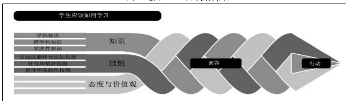
图1 迈向2030年的教育框架

OECD对素养的概念进行了区分,素养分为两种,英文分别是“literacy”和“competency”。因为翻译的原因,这两个词都可以翻译成素养。根据OECD的界定,PISA测试中的阅读素养、数学素养、科学素养和财经素养都采用的是“literacy”这个词。从这些测试的内容可以看出,“literacy”主要针对15岁的学生将学校所学得的知识与技能应用于日常生活,并在面临各种情境和挑战时所具备的素养与能力。